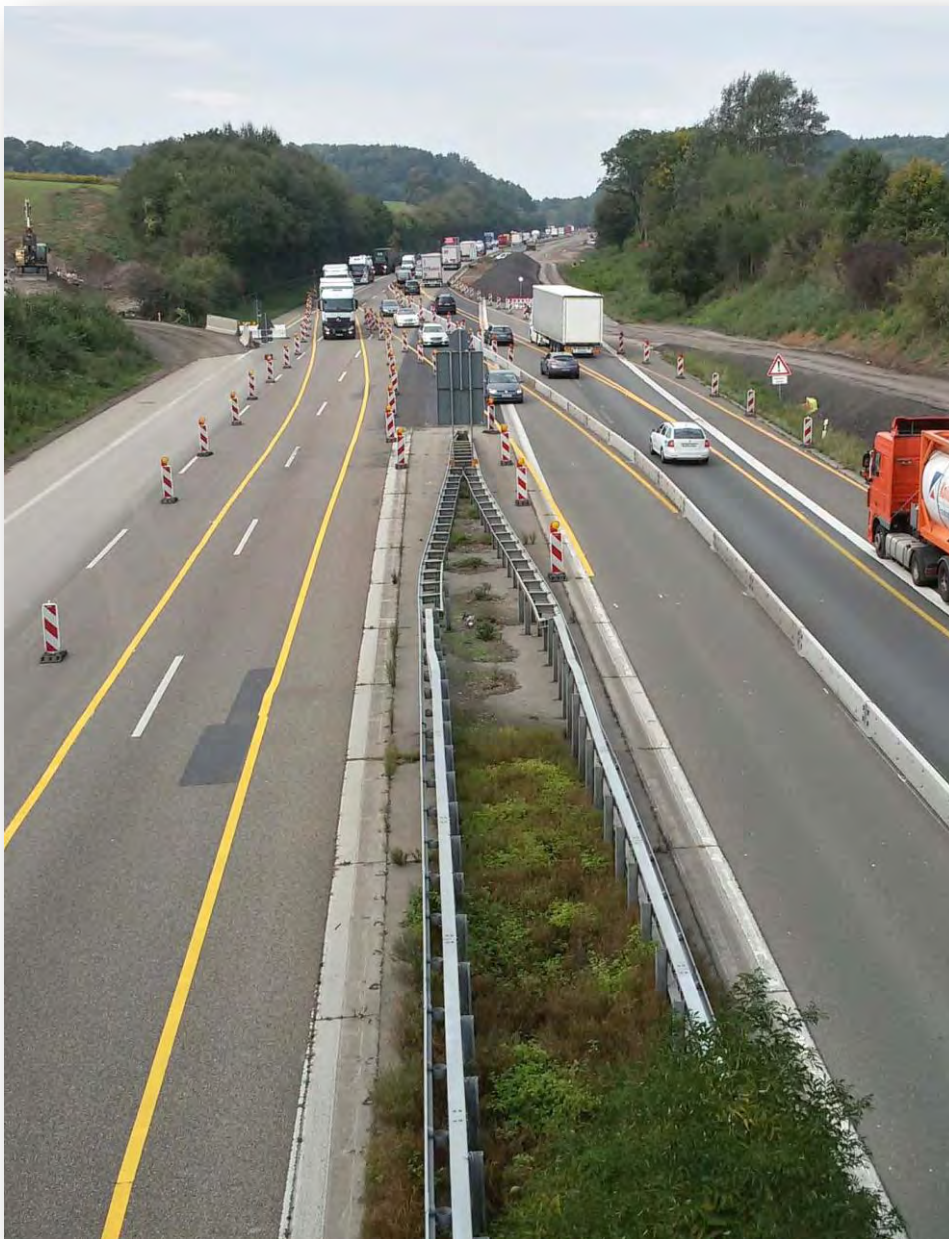
Blick auf die Großbaustelle der A6 bei Balzfeld.

Für die Flächenbereitstellung zum Ausbau der Bundesautobahn A6 zwischen den Anschlussstellen Wiesloch/Rauenberg und Sinsheim wurde am 20.11.2013 das Flurbereinigungsverfahren Dielheim-Balzfeld (A6) angeordnet. Mit dem Flurbereinigungsbeschluss sind alle Grundstückseigentümer und Erbbauberechtigten zu Teilnehmern am Verfahren geworden.