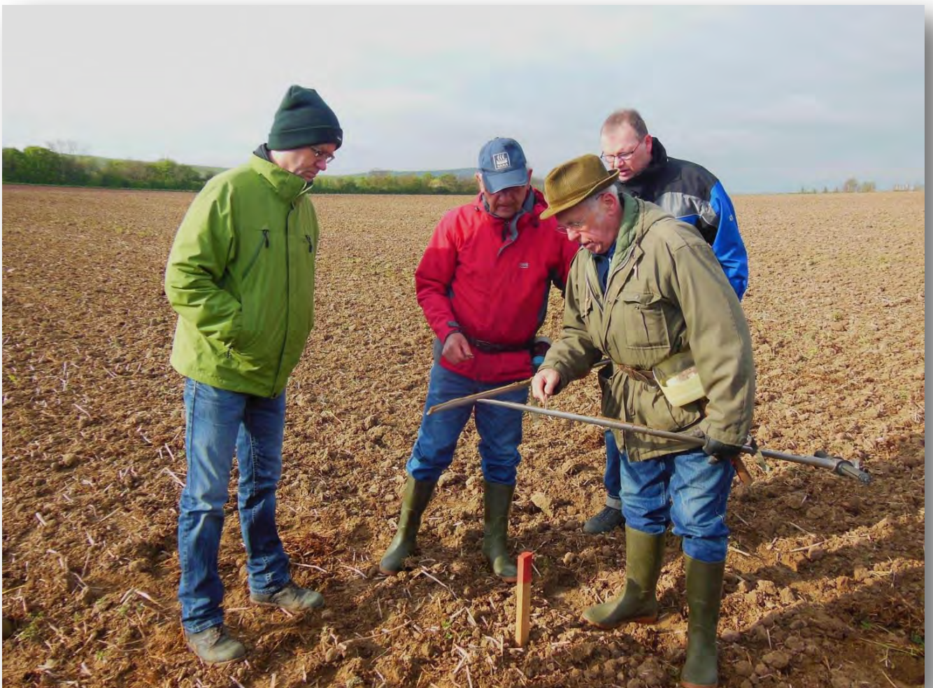
Überprüfung der Böden durch die landwirtschaftlichen Sachverständigen.

In der Folge konnten die Wertermittlungsergebnisse der auf dem Gebiet der heutigen Flurneuordnung bereits früher durchgeführten Flurbereinigungsverfahren flächendeckend als Grundlage verwendet werden - nur in begründeten Einzelfällen wurden Werte durch Nachverprobungen an aktuelle Veränderungen angepasst oder korrigiert.